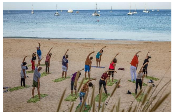
Mangosteen Ayurveda & Wellness Resort****+.

Ebenfalls in Thailand bietet das Mangosteen Ayurveda & Wellness Resort**** auf der Insel Phuket ein Intensiv-Retreat für Longstays. Das familiengeführte Boutique-Resort mit Ayurveda Spa lockt mit tropischem Flair und entspannter Atmosphäre. In besonderer Strandlage praktiziert hier ein indischer Ayurveda-Arzt und es werden Yoga-Retreats oder tiefenwirksame Wellness-Auszeiten angeboten.