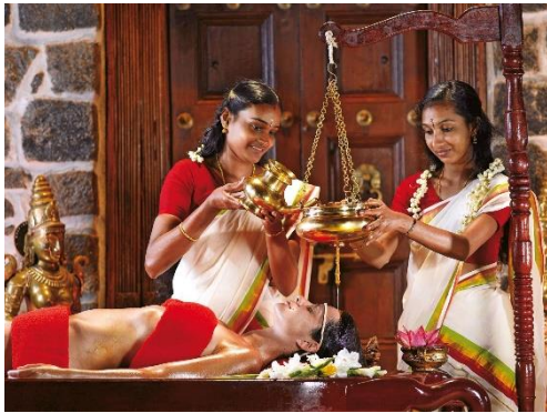
Somatheeram Ayurvedic Health Resort.

In Indien wird eine mehrwöchige Ayurvedakur zur Tiefenregeneration beispielsweise im Somatheeram Ayurvedic Health Resort in Chowara-Trivandrum (Kerala) angeboten. Es liegt in tropischer Hanglage mit Zugang zum Strand und verfügt über eines der besten Ayurveda-Zentren des Landes. Seit seiner Gründung im Jahr 1990 gehört es zum ersten Ayurveda-Resort Indiens mit westlichem Standard und wurde von der Regierung Keralas bereits zehnmal zum besten ayurvedischen Zentrum