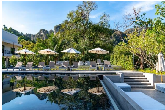
The Pavilions ANANA Krabi, ecological*****.

Langzeiturlaub-Preisbeispiel: Fit Reisen-Paket „ Entspannung am Meer “ mit 21 Nächten in der Suite und Halbpension inklusive Benutzung von Swimmingpool, Fitnessbereich und WLAN, Teilnahme am Aktivprogramm nach Angebot (beispielsweise Bauch-Beine-Po, Cross Fitness oder Kajaking), Gemeinschaftsprogramm nach Angebot (beispielweise Freilichtkino und Lagerfeuer) und Shuttleservice nach Agadir (zweimal täglich, nach Voranmeldung) ab 1.793 Euro pro Person.