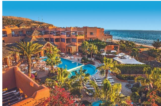
Hotel Paradis Plage Resort*****.

Wen es über den Winter in die Wärme zieht, findet ideale Bedingungen für einen Langzeiturlaub in Marokko . Sowohl Kulturinteressierte als auch Sonnenanbeter und Aktivurlauber lockt das nordafrikanische Land. Besonders Surfer und Yogafans kommen im Hotel Paradis Plage Resort***** , nördlich von Agadir, auf ihre Kosten. Es ist Marokkos erstes Öko-Resort, befindet sich direkt am Atlantik mit Surf-Spot und bietet ein vielfältiges Erholungs- und Aktivprogramm – auch für Golfer. Stilvolles Ambiente, ein weitläufiger Sandstrand und marokkanische Gastfreundschaft versprechen einen gelungenen Aufenthalt.