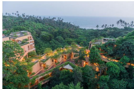
Barberyn Beach Ayurveda Resort.