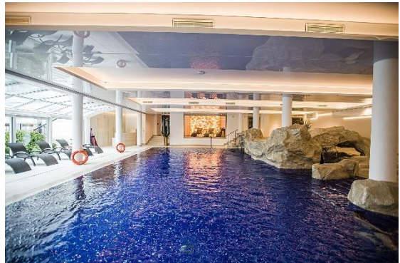
Lubicz Hotel Wellness & Spa****.

erwartet das Haus seine Gäste mit seinem besonderen Interieur. In einigen Zimmern und im Restaurant sind noch Fragmente der ursprünglichen Holzkonstruktion der alten Mühle, die später in das Hotel umgebaut wurde, zu sehen. Das Hotel verfügt über ein Spa- und Wellnesszentrum mit Pool und Hydromassagesitze, Jacuzzi, Saunen und Aromatherapie in der Salzgrotte. Des Weiteren werden Ayurveda-Massagen gegen Gebühr angeboten.