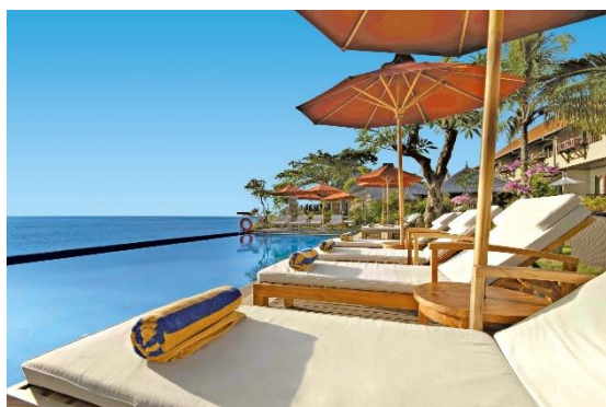
Tauch Terminal Tulamben****.

Langzeiturlaub-Preisbeispiel: Fit Reisen-Paket „ Wellness Auszeit “ mit 21 Nächten und Vollpension inklusive täglichem Weizengras-Shot oder Gemüsesaft, täglichen Spa-Anwendungen nach Verordnung und Schwerpunkt (wie beispielsweise Schlamm-, Detox, Grüner-Tee-Wickel, Kokosnussöl-, Balance- oder Thai-Energie-Massage), täglichem Gruppen-Yoga, Benutzung von Außenpool, Fitnessraum, Mineralwasser und täglich frischen Früchten im Zimmer, Shuttle zum Nai Harn Beach und Markt sowie WLAN ab 3.020 Euro pro Person.