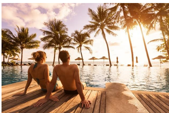
Longstay-Urlaubsangebote für Wellness- und Gesundheitsfans gibt es bei Fit Reisen.

Frankfurt, 01. November 2022. Im kuscheligen Bademantel in den Spa schlendern klingt doch viel besser als bei dunklem, kaltem Winterwetter zu Hause auf das Heizungsthermostat zu starren: Longstay-Reisen waren lange ein Best Ager-Trend. Durch steigende Energiekosten, Inflation und die Möglichkeit zur „Workation“ wird der Langzeiturlaub aber auch bei jüngeren Zielgruppen immer beliebter. Ein breitgefächertes Angebot bieten dabei