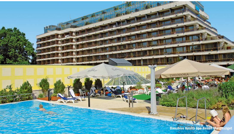
Danubius Health Spa Resort Margitsziget