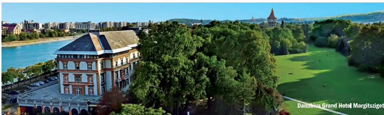
Danubius Grand Hotel Margitsziget